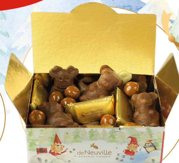
25. Ballotin de Noël 15,70€ 12,45€