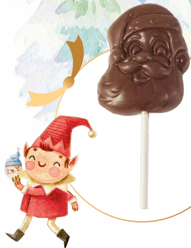
24. Sucette Père Noël en chocolat au lait 3,10€ 2,75€

Garni d'un sachet de petits sujets en chocolat, de papillotes et de boules en chocolat