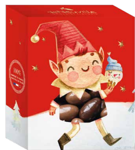
27. Étui petit lutin 4,10€ 3,20€