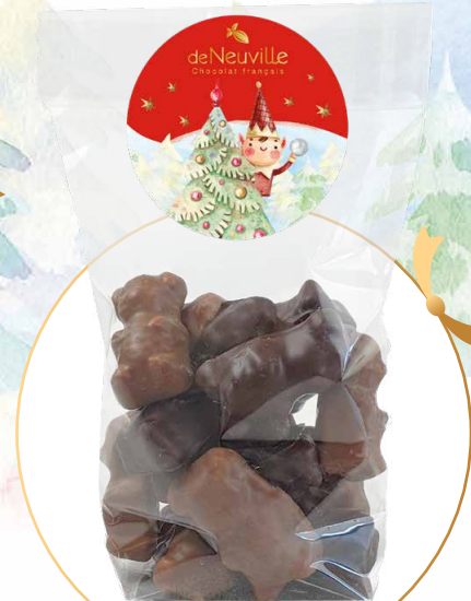
26. Sachet de petits ours en guimauve 9,90€ 8,40€