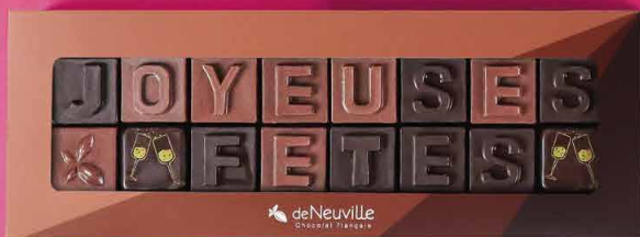
13. Message « Joyeuses Fêtes » 14,90€ 12,90€