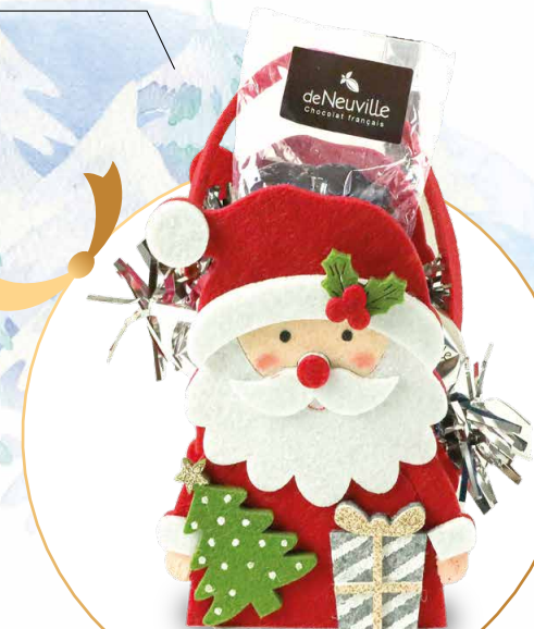
29. Sac feutrine Père Noël 12,60€ 9,45€