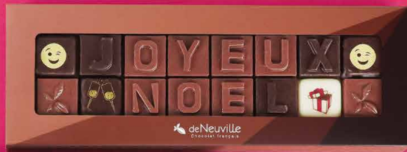
11. Message « Joyeux Noël » 14,90€ 12,90€

Ce message à croquer est le cadeau idéal pour les comités d'entreprise ou vos cadeaux d'affaires.