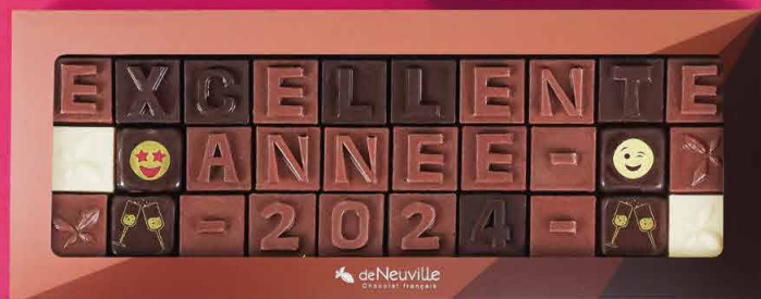
12. Message « Excellente année 2024 » 24,90€ 20,60€