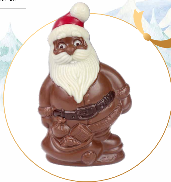
28. Père Noël et sa hotte en chocolat au lait 9,90€ 8,10€